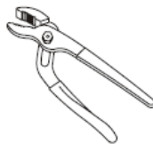
Groove Joint Pliers